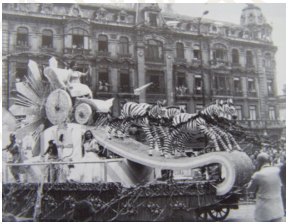
Carrossa construïda per al Carnestoltes d'Estoril (Portugal).