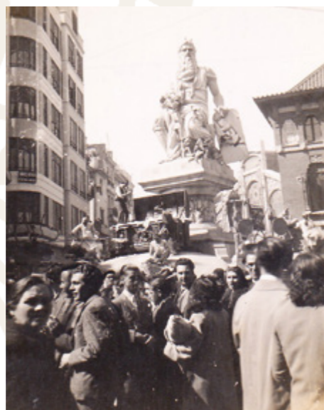
So Quelo s'ha fet forner, Plaça del Cabdill, 1946.