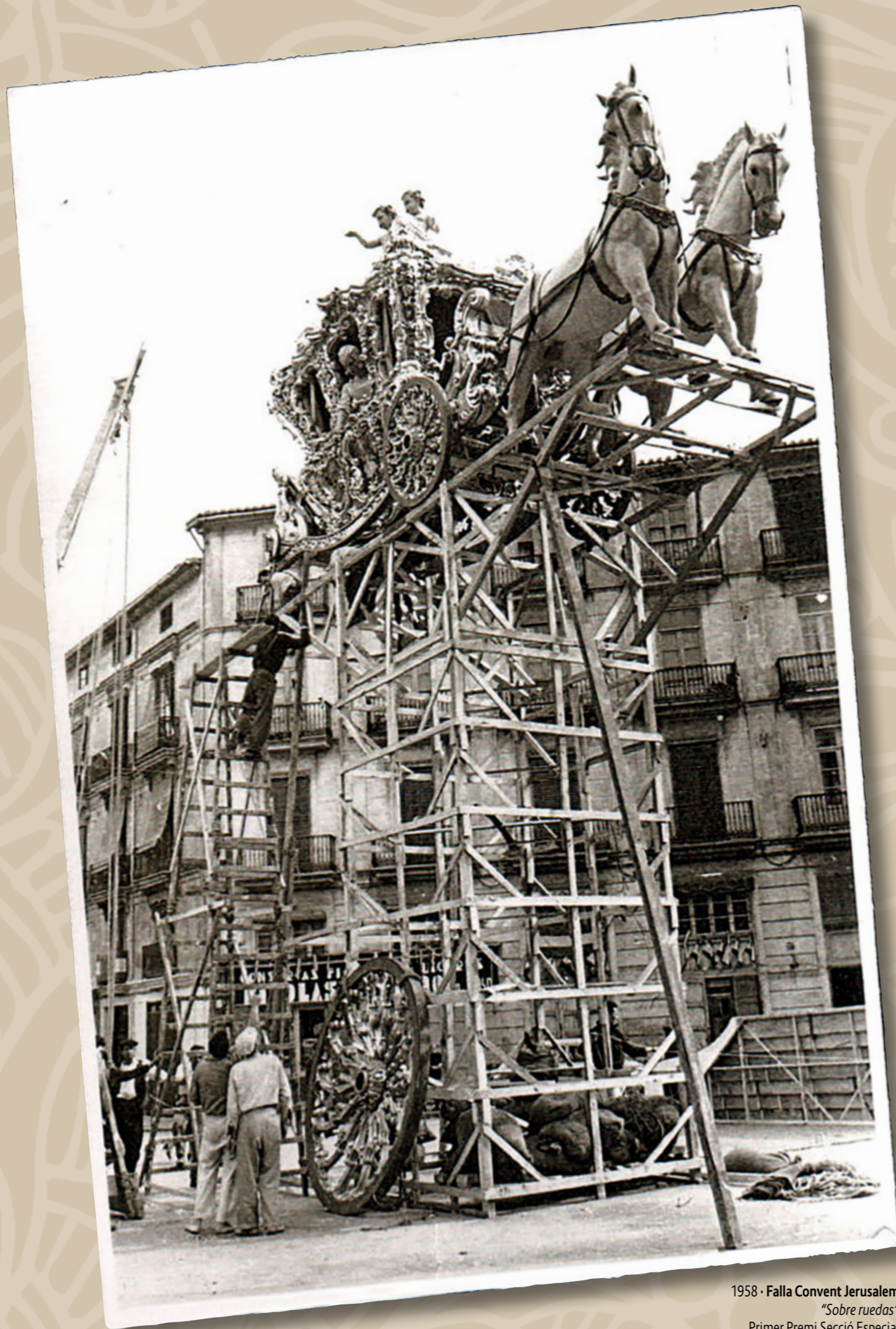
1958 · Falla Convent Jerusalem "Sobre ruedas" Primer Premi Secció Especial