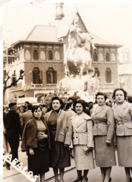
Jo sóc la vaca lletera, Mercat Central, 1955. Arxiu Iván Esbrí.

L'excepció a la norma d'esta etapa de falles menys afamades de Regino Más és Subvencions , el 1954, amb la premisa "Madrid ens furta" com bandera. La Font de la Cibeles, emblema de la capital de l'Estat, representava la negativa rotunda i continua del govern central en destinar partides presupostàries per a que València duiguera a terme els magnes projectes urbanístics, sobretot els vinculats amb el problema greu dels passos a nivell, a suprimir amb el soterrament de la xarxa ferroviària de via estreta reconvertida en metro i una nova Estació del Nord extramurs (Esbrí, 2014: 36-43).