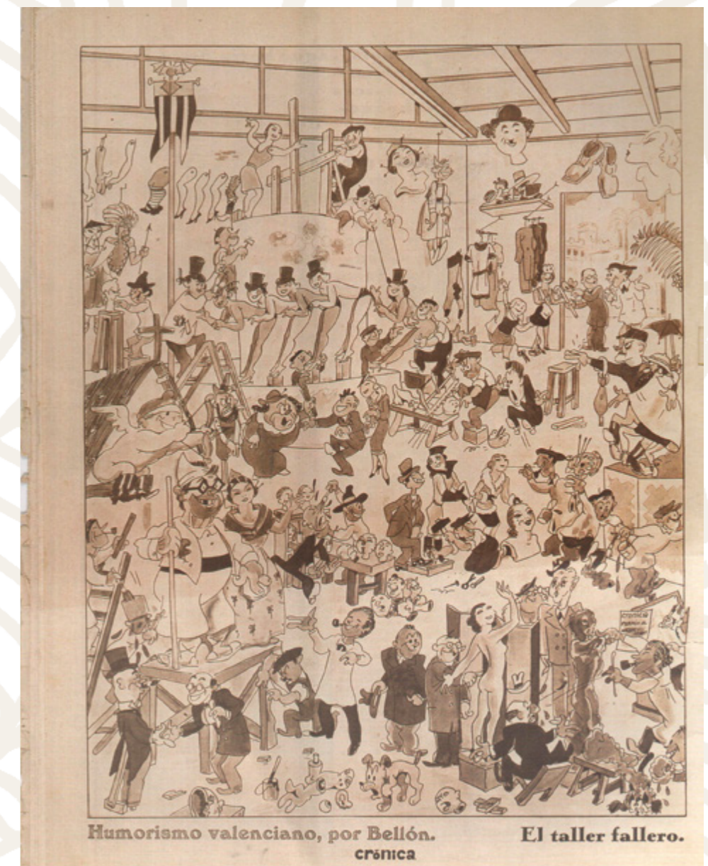
Humorismo valenciano, por Bellón. crónica

"La vaig fer amb gran afecte, el primer dia va caure un aiguat molt fort i es va trencar el paper que cobria les bases. La falla la considerava com alguna cosa personal, així que em vaig portar aquells quadres a casa els peguí, vaig aconseguir assecar-los amb les planxes de carbó de la meua mare i els vaig repintar"