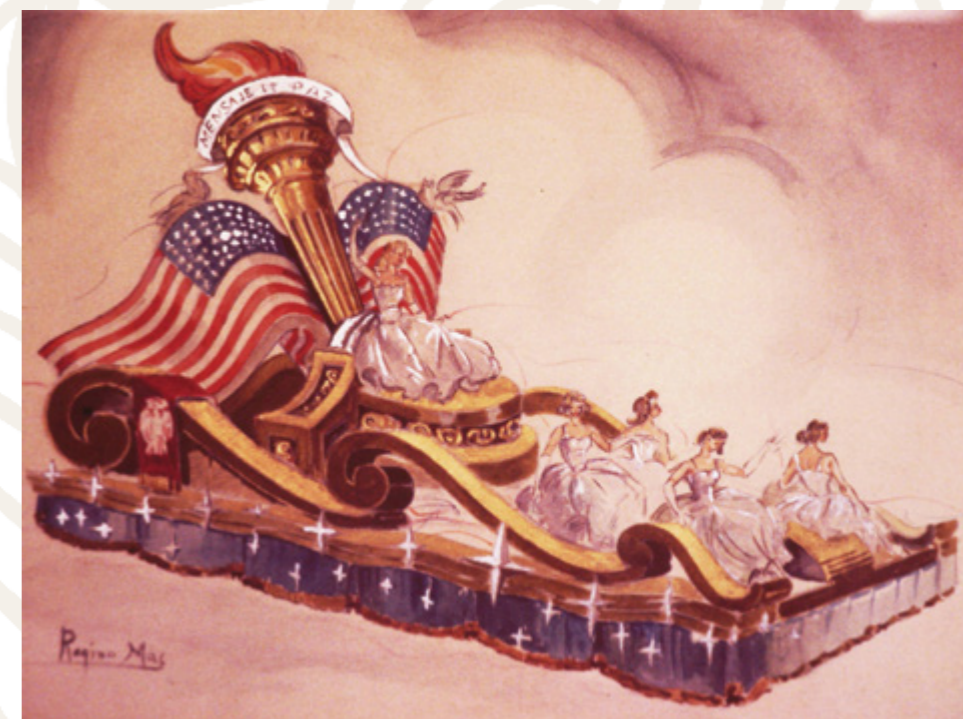
Esbós d'una de les carrosses construïdes a República Dominicana.