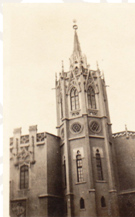
Palau de l'Exposició, seu del Museu Municipal del Folklore, ca. anys 30.