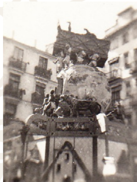
L'Arca de Noé, Plaça de Lope de Vega, 1935.