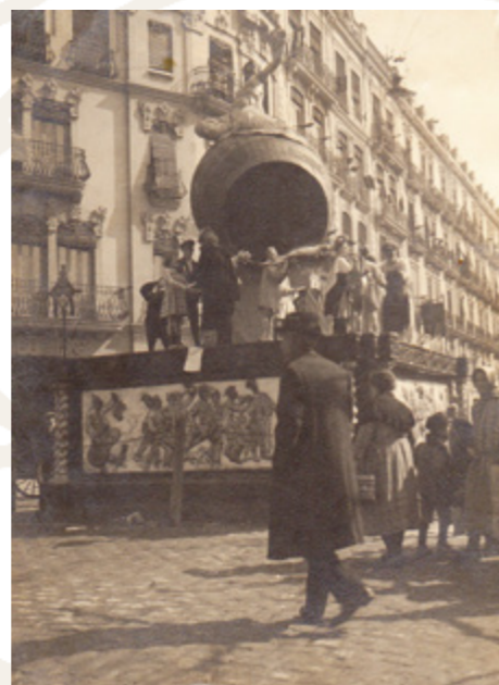
Falla Sorní-Gravador Esteve, 1925.

Des d'un vessant més costumbrista, el 1928, reproduí el Tribunal de les Aigües, a la Plaça de la Mercé, i va cantar als madrilenys les excel·lències de les tradicions valencianes a la falla obrada amb Abelardo Guillot a Doctor Moliner-Puerto Rico, arrel de l'èxit del Tren Faller Madrid-València de 1927.