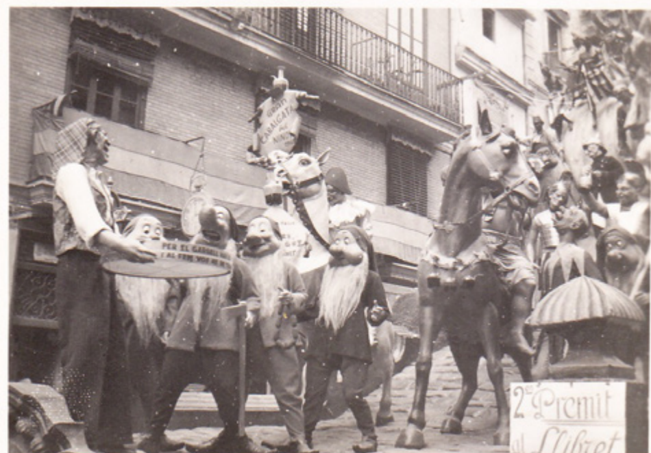
Escena de La Cavalcada del Ninot protagonitzada pels Set Enans de Blancaneus, Plaça de Sant Jaume, 1943.