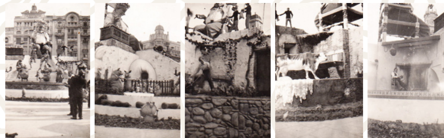
Vistes de So Quelo, Rei de l'Horta, Plaça del Cabdill, 1942.

Així, contràriament al que Regino podia haver plantejat per a esta plaça -una falla més apologètica i d'exaltació folklòrica-, va optar per fer una crítica explícita a l'enriquiment en brut amb el mercat d'estraperlo, al qual la ciutadania es veia abocat per completar les paupèrrimes quantitats estipualdes a les cartilles de racionament. Assempat sobre la seua acurada cadira i coronat com monarca del camp valencià, So Quelo observava feliç, complagut, sorneguer i sense escrúpols els beneficis reportats per la venda baix mà de creïlles, fessols, melons, carxofes, boniato, etc. i l'intercanvi d'estos per sucre, oli, farina, llet, peix o tabac.