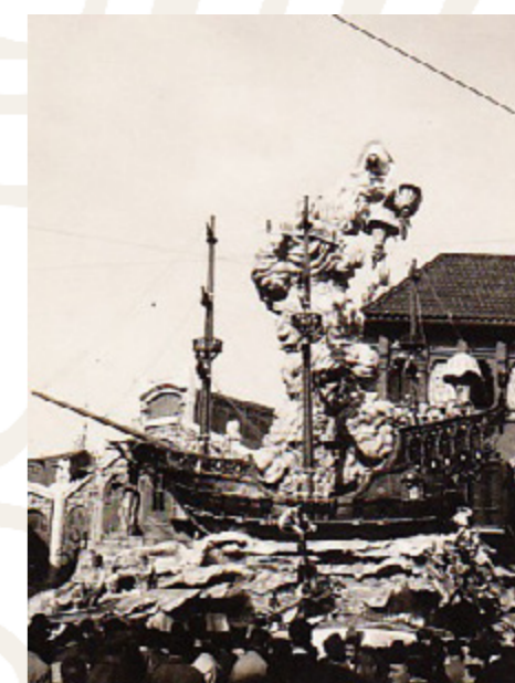
Lluita lliure / Batalla comercial, Mercat Central, 1948 i 1949.

A la poc coneguda Ciutat sense llei , a Barques-Pascual y Genís, el 1946, Regino va denunciar l'establiment de poblats xabolistes al riu Túria amb el problema de salubritat que això suposava. Valga dir que arrel de les funestes conseqüències de la Riua del 1957, l'Ajuntament va prohibir els assemtaments al riu.