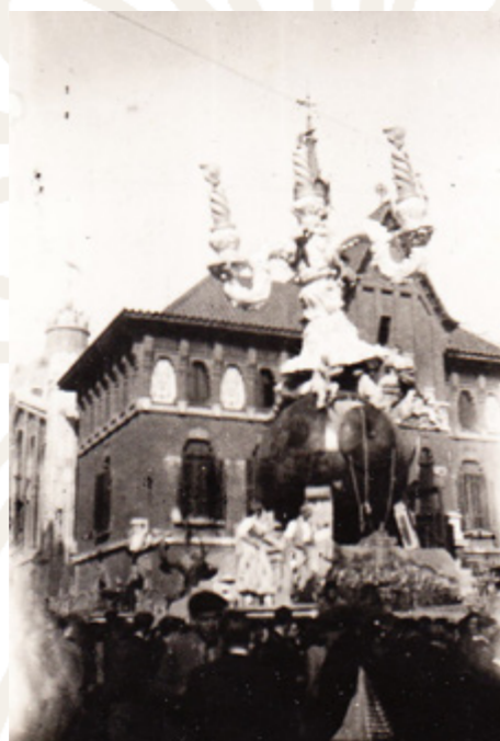
La banyolada principal, Estació del Nord, 1944.