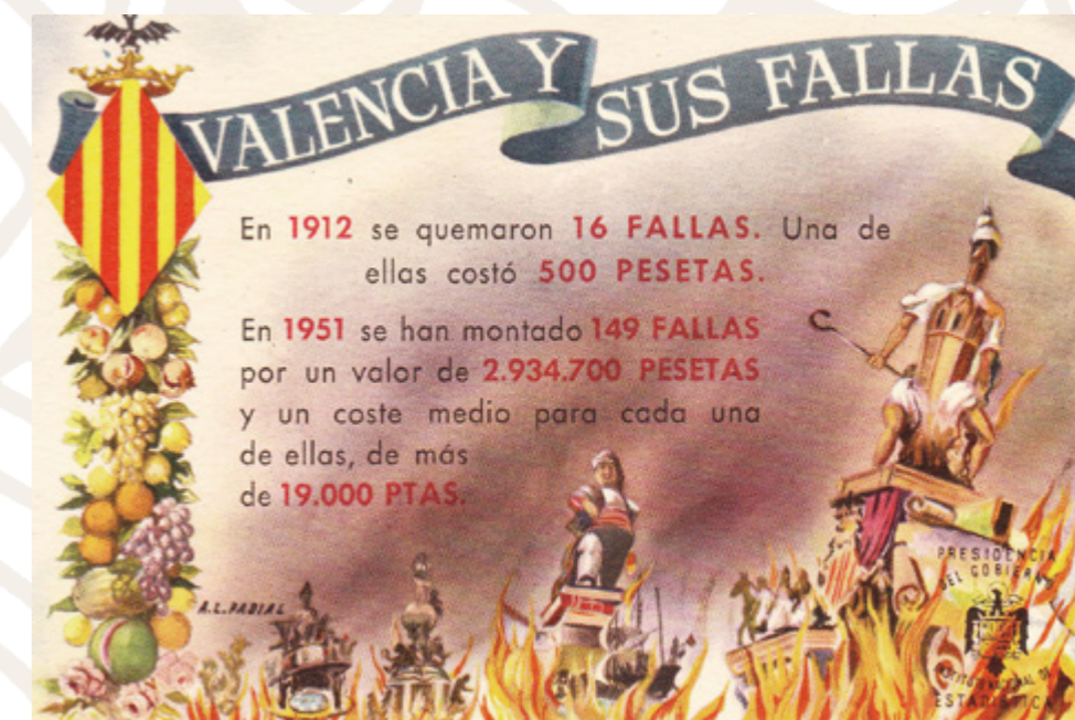
Valencia y sus Fallas, postal publicitària del Institut Nacional d'Estadística, 1951, amb al·legories de falles de Regino Más. Arxiu Iván Esbrí.

Regino Más va practicar un estil de falla entre l'academicisme i el gust per l'escultura grecoromana amb matices de caricatura continguda pròpia de les fantasies animades del cartoon nordamericà. Els ninots els moldejava seguint l'autenticitat de la forma natural. De fet inclús les figures més socarrones no perdien del tot certa expressió real 2 .