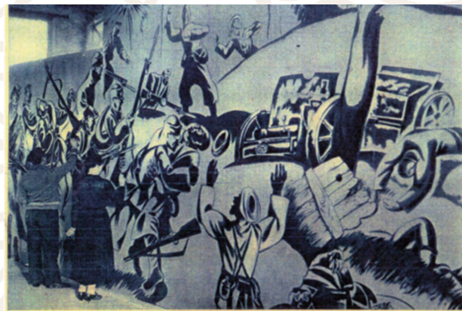
En una de las bases del torreón de propaganda que la Alianza de Intelectuales para la Defensa de la Cultura alzarán en la plaza de Castelar, de Valencia, figurará este cuadro que evoca la heroica lucha sostenida por los defensores de Madrid.